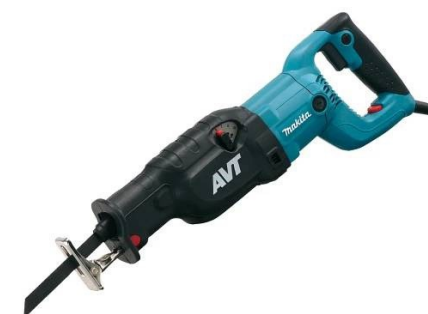
PILKA OCASKA na dřevo, kov, porobeton