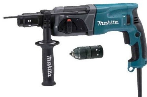
Vrtací kladivo 2,3J,720W