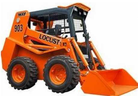
Smykem řízený nakladač

S obsluhou 480 Kč/hod Bez obsluhy 3000 Kč/den