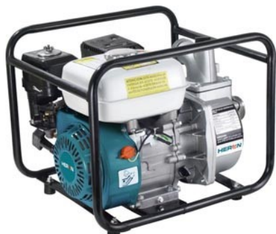
HERON EPH 80 – čerpadlo benzínové

MISTROVICE 222 561 64 Jablonné nad Orlicí Tel./Fax.: 777 333 732 Mobil: 777 222 159 e-mail: kozel.stavby@seznam.cz www.kozel-stavby.cz