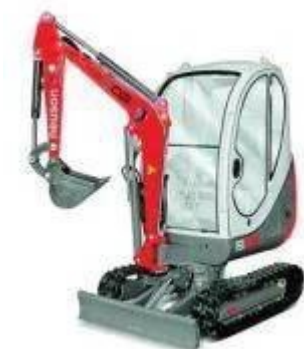
MINIBAGR - pásové rypadlo 1700 - 2000 kg