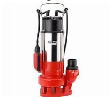
Čerpadlo kalové elektro