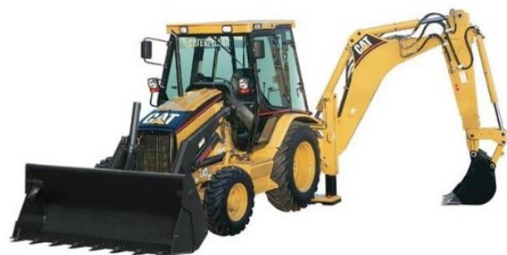
Traktor bagr CET včetně obsluhy