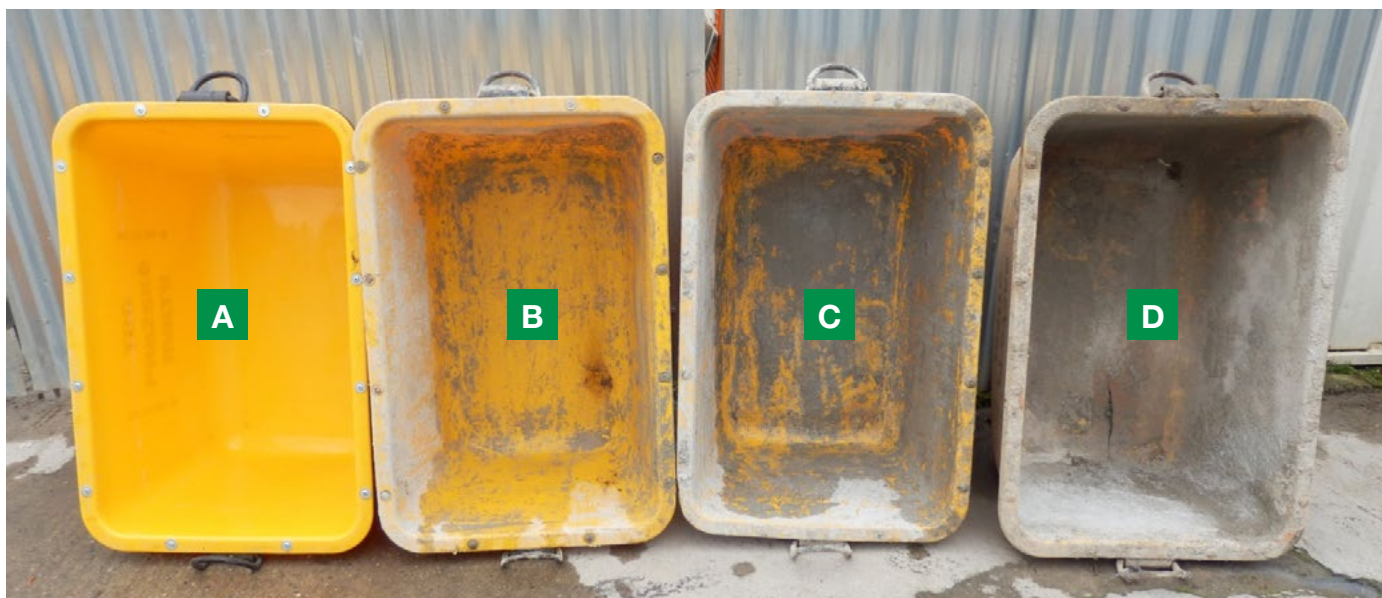
FOTO 1 – Ilustrativní vyobrazení jednotlivých kategorií opotřebení kontejnerů (van).