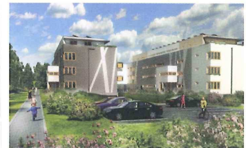
Jahodnice Praha 14 – Hostavice

Bydlení pro milovníky komfortu a vysokého standardu, navíc u přírodní památky stolová hora Vidoule. Kousek na golf i na letiště. str. 14