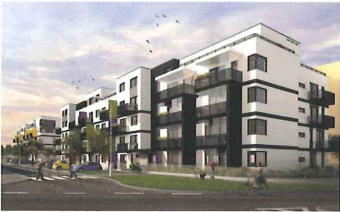
U cukrovaru Praha 12 – Modřany

Ideální bydlení pro rodiny s dětmi uprostřed zeleně, s autobusovými zastávkami přímo u projektu a s vlakem v docházkové vzdálenosti. str. 16