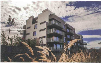
Botanica Praha 5 – Jinonice

Bydlení pro milovníky komfortu a vysokého standardu, navíc u přírodní památky stolová hora Vidoule. Kousek na golf i na letiště. str. 14