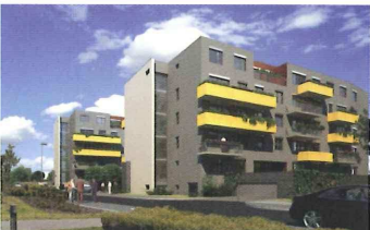
Chodovec City Affinity, Opportunity Praha 11 – Chodovec

Stylové bydlení pro stylové lidi. Moderní bytový dům jen s padesáti byty. V lokalitě, která nabízí vše, co potřebujete k pohodlnému životu. Od sportovních zařízení, přes obchody a restaurace až po kulturní vyžití v Chodovské tvrzi. str. 8