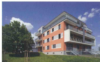
Milíčovský háj Praha 11 – Háje

Stylové bydlení pro stylové lidi. Moderní bytový dům jen s padesáti byty. V lokalitě, která nabízí vše, co potřebujete k pohodlnému životu. Od sportovních zařízení, přes obchody a restaurace až po kulturní vyžití v Chodovské tvrzi. str. 8