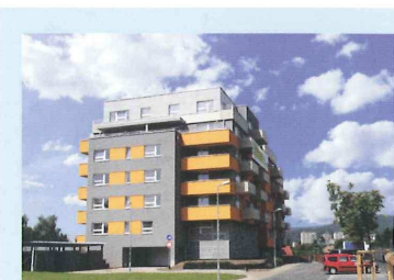
Nová Ruda Liberec, Vratislavice

Všestrannost použití těchto izonosníků je možná díky tomu že mohou být namáhány ve třech různých osách současně. V případě potřeby přenesou vysoká zatížení přes poměrně úzké konzoly a lze je uspořádat i vertikálně. Nerezový můstek, unifikace druhů, kvalitní statická řešení předurčují jejich úspěch.